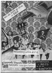
salé newsletter / leden 2014